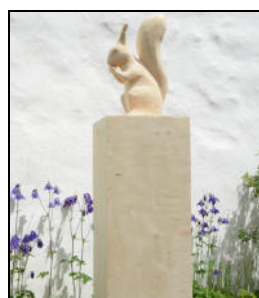
Simon Simonett Wiesen / GR